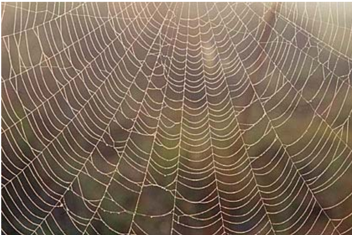
Teia de Aranha

Nossos atos mágicos devem ser minuciosamente calculados em todas as possibilidades que nos são possíveis perceber para ter sucesso do contrário pode ser um desastre total. Por isso devemos sempre exercitar a mente e fazer exercícios para pode elevar o nível mental e assim ver uma gama maior de possibilidades, pois ainda que pensemos e repensemos muitas vezes não enxergamos tudo o que deveríamos. Por isso aquele que quer aprender magia não pode ter pré-conceitos, deve estar aberto aos novos horizontes, esquecer tudo o que lhe ensinaram desde a infância, derrubar dogmas e conceitos éticos e morais e acima de tudo não acreditar em nada e analisar tudo. Para isso é preciso vencer o medo.